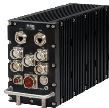
M-Max 810 EP/MMS

M-Max 810 EP/MMS — защищенный промышленный компьютер с высочайшей производительностью, доступной на сегодняшний день для систем с пассивной системой охлаждения. Демонстрируя высокую стойкость к ударам и вибрациям, он может работать при экстремальных температурах (от -40 до +55 °C), в условиях пыли и влажности. Достоинства системы не ограничиваются великолепной производительностью, достигаемой благодаря четырехъядерному процессору Intel Core i7 (2.1-3.0 ГГц), компьютер также имеет отличные 2D и 3D графические возможности, реализуемые через VGA и HDMI интерфейсы. Система хранения данных выполнена с применением промышленных SSD и включает возможность построения RAID-массива (программно и аппаратно).