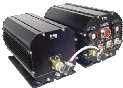
M-Max 700 ST/IFT

M-Max 700 ST/IFT — специализированная система, которая состоит из двух блоков: системного и батарейного. Системный блок представляет собой стандартный компьютер M-Max 700 с разъемами СНЦ и Vulgin на лицевой панели. Система бесперебойного питания состоит из устройства интеллектуальной зарядки батарей, размещенного в системном блоке, и двух батарейных модулей, расположенных в батарейном блоке. Батарейный блок обеспечивает работу системного блока на протяжении 4 часов.