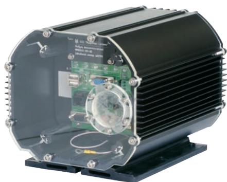
M-Max 800 EP2/PLT

Компьютерная платформа M-Max 800 EP2/PLT разработана для быстрого развертывания нескольких модификаций систем, каждая из которых имеет собственный набор плат расширения формата PC/104 и внешних разъемов. Платформа оснащена встроенной системой подогрева и предусматривает подключение дополнительной системы подогрева плат заказчика. Компьютер может поставляться с технологическим модулем, на который выведены индикация и разъемы установленных интерфейсов. Для проведения испытаний в термокамере, компьютер комплектуется специальной прозрачной передней панелью, обеспечивающей доступ