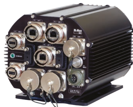
М-Мах 800 EP2/TRN-02

Этот компактный блок уместается в ограниченном пространстве и может работать в расширенном температурном диапазоне от -40 до +65 °С без вентиляции и активного охлаждения. В конструкции системы используется запатентованная MicroMax технология отвода тепла от вибронегруженных электронных компонентов. Опции системы хранения включают промышленные твердотельные накопители с RAID-функциональностью (программной и аппаратной).