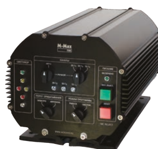
M-Max 700 ST/NRC

M-Max 700 ST/NRC — специализированный компьютер, разработанный для применения на транспорте. Он оснащен большим количеством изолированных цифровых и аналоговых портов ввода/вывода. На переднюю панель выведены необходимые заказчику средства управления и индикации.