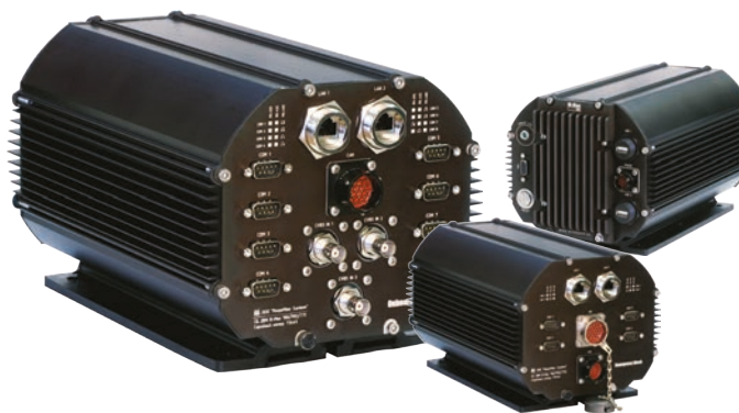
M-Max 700 PR/TTI

M-Max 700 PR/TTI — это комплект из двух компьютеров (мобильного и стационарного), для использования в транспортной системе сбора данных. Система оснащена портом видеозахвата CVBS, интерфейсом CAN, набором портов RS-232/422/485, а также портами цифрового ввода/вывода. Каждый из блоков, разработанных для эксплуатации в крайне тяжелых условиях, имеет в своём составе ИБП, построенный на суперконденсаторах.