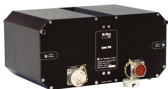
М-Мах 400 ST/USO

М-Мах 400 ST/USO — это отказоустойчивый компьютер для бортовых и стационарных приложений, предназначенный для достоверной обработки информации систем железнодорожной сигнализации, построенный на основе архитектуры «2-из-2». М-Мах 400 ST/USO полностью соответствует спецификации CENELEC SIL4. Он предназначен для использования на стационарных объектах железнодорожной инфраструктуры. Система, устойчивая к вибрациям и ударам, способна работать при температуре от -40 до +60 °С. Для достижения высокого уровня надежности система объединяет в одном герметичном