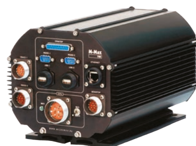
М-Max 700 Performance

М-Max 700 ST/GZR — защищенный транспортный компьютер. Является новой версией предыдущей модификации, со следующими усовершенствованиями: