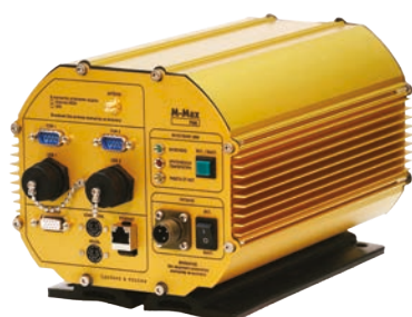
М-Max 700 ST/GZR

В таком же корпусе существует другая версия М-Max 700, в которой вместо радиомодема установлен 12-канальный GPS-приемник.