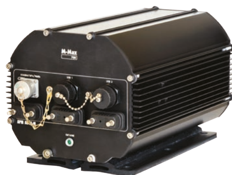
М-Max 700/ARM mk.4

В таком же корпусе существует другая версия М-Max 700, в которой вместо радиомодема установлен 12-канальный GPS-приемник.