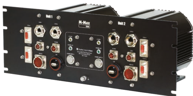
М-Мах 820 EP/USO

М-Мах 820 EP/USO состоит из двух защищенных промышленных компьютеров с самой высокой производительностью, доступной на сегодняшний день для решений с пассивным охлаждением. Система с архитектурой «2-из-2» обеспечивает достоверную обработку информации в экстремальных условиях окружающей среды. Система хранения данных выполнена с применением промышленных SSD и включает возможность построения RAID-массива (программно и аппаратно). М-Мах 820 EP/USO предназначен для решения задач оптической рефлектометрии при построении систем контроля и безопасности.