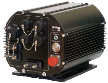
M-Max 800 EP1

M-Max 800 EP1 – защищенный высокопроизводительный компьютер для жестких условий эксплуатации. Построен на процессоре Intel Core i7 (до 2,9 ГГц) и оборудован разъемами, защищенными по классу IP67. Герметичный корпус компьютера с запатентованной технологией пассивного отвода тепла защищает систему от ударов, вибрации, пыли и влаги. Вычислительная мощь M-Max 800 EP1 сопоставима с настольными системами. В данной модели компьютера возможно использование как стандартных, так и защищенных кабельных соединителей (общая степень защиты IP65 достигается при использовании последних).