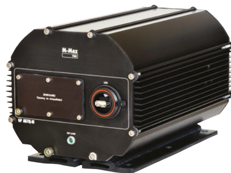
M-Max 700/CR mk.3

Устанавливаемый на локомотивах M-Max 700/AR предназначен для записи сигналов автоматической локомотивной сигнализации (АЛС) и систем автоблокировки с тональными рельсовыми цепями (АБТ) непосредственно с датчиков импульсов, местоположение фрагментов записи которых привязывается по сигналам системы глобального позиционирования. Кодирование сигналов АЛС непрерывного действия может быть как импульсно-числовое, так и частотное — для АЛСН, и фазоразностное — для АЛС-ЕН. Одновременно с полезным сигналом производится запись присутствующих в канале помех, попадающих в рабочую полосу частот сигналов АБТ и АЛС. Непрерывная запись сигналов проводится в автоматическом режиме. Изделие применяется совместно с системами АБТ, построенными с применением тональных рельсовых цепей (ТРЦ) типа 3 (от 420 до 780 Гц).