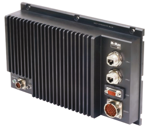
M-Max 871 EP2/MMS

Защищенный высокопроизводительный компьютер для экстремальных условий эксплуатации. Корпус M-Max 871 EP2/MMS совместим со стандартом VITA75 и может использоваться в жестких условиях окружающей среды. Подходит для установки на различные виды транспортных средств. Легкий и компактный герметичный корпус с запатентованной технологией пассивного отвода тепла защищает от пыли, влаги, ударов и вибрации. Компьютер способен работать при температурных колебаниях от -40 до +65 °С. Вычислительная мощность M-Max 871 EP2/MMS сопоставима с настольными системами.