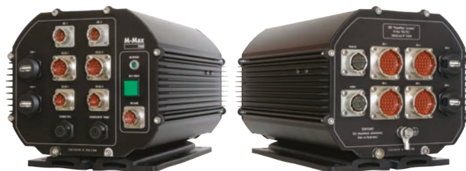
M-Max 700 ST/PLT

M-Max 700 ST/PLT с классом защиты IP54 изготовлен по техническому заданию заказчика для применения в качестве бортового авиационного компьютера. Помимо модификации подсистем ввода-вывода и разъемов, в компьютер интегрированы две PCI-платы заказчика, что потребовало серьезной инженерной проработки проекта. В целом, отличия можно перечислить следующими пунктами: